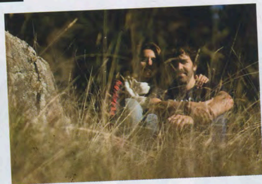
Pensando en Blanco www.pensandoenblanco.com

“Pensando en Blanco surge del deseo de desarrollar proyectos y objetos que nos gusta que existan”, comentan sus creadores. Esta firma actúa en una gran diversidad de áreas dentro del diseño: utilizan maderas recicladas para realizar muchos de sus muebles a medida, fibras naturales en aislamientos y rellenos biodegradables y reciclados en su colección de Sacos 03AM. “Intentamos que el mensaje y la estética sean atributos adquiridos en el proceso de fabricación de todos nuestros productos.”